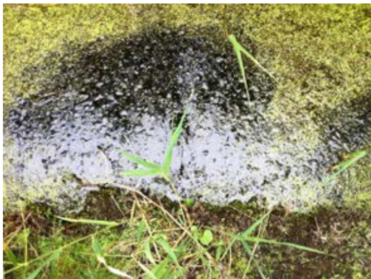
Figur 2: Stillestående iltfattigt vand i Fanøs vandløb.

I de få vandførende strækninger kommer vandet fra spildevandsudledninger fra bebyggelse/campingplads. Det vurderes ikke muligt, at foretage biologisk vandløbsbedømmelse i vandløbene. På grund af sommerudtørring af vandløbene er deres værdi som levested for vandløbsarter ringe.