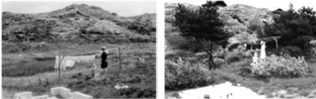
Figur 1: Samme motiv fra sommerhusområdet 1967 og 2003.

For at gøre grundene bebyggelige og for at sikre, at veje og lavtliggende sommerhuse ikke står under vand i vinterperioden, er der af flere omgange sket en vandstands-sænkning i sommerhusområderne. Dette kombineret med en udsivning af næringsstoffer fra nedsivningsanlæggene har medført en meget kraftig tilgroning af områdets vådområder samt ændret vegetationen betragteligt, se Figur 1.